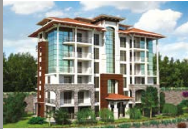
Beşevler Sanabel Konakları