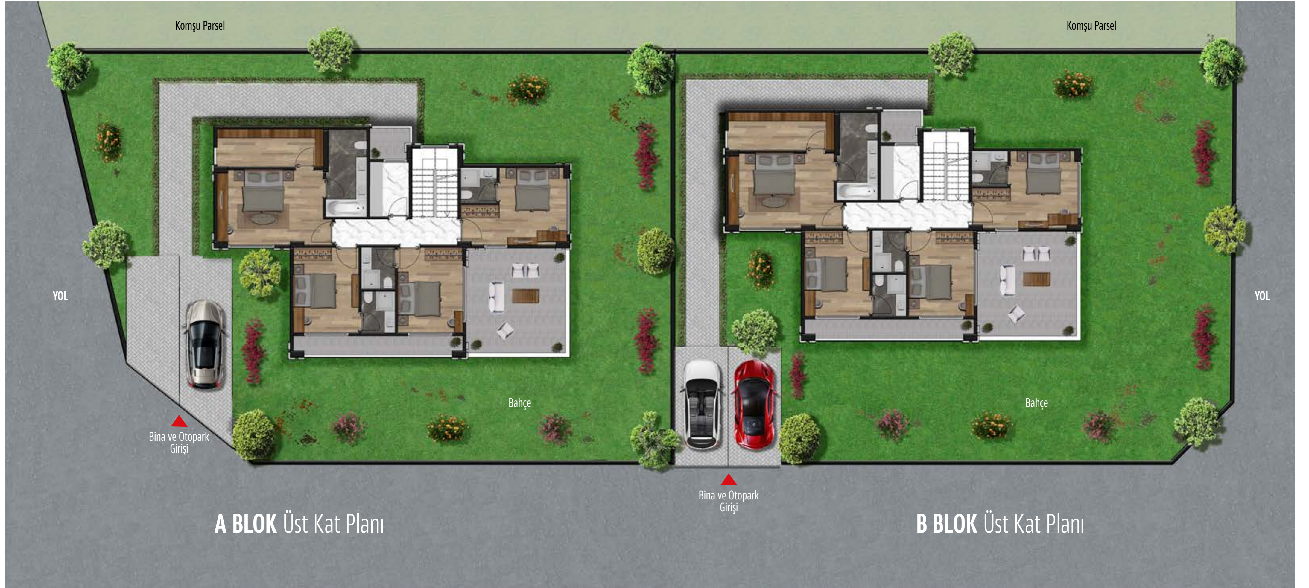
A BLOK Üst Kat Planı