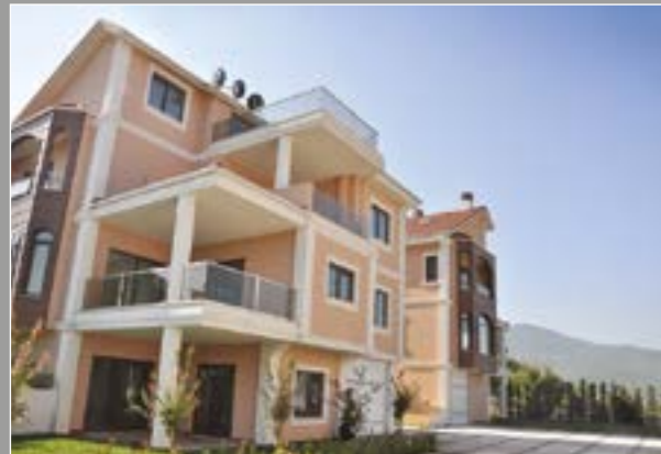
Demirci Sanabel Villaları