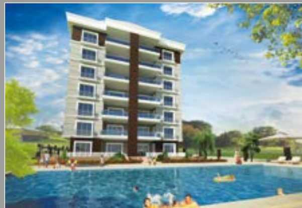
Batkent Sanabel Apartmanı