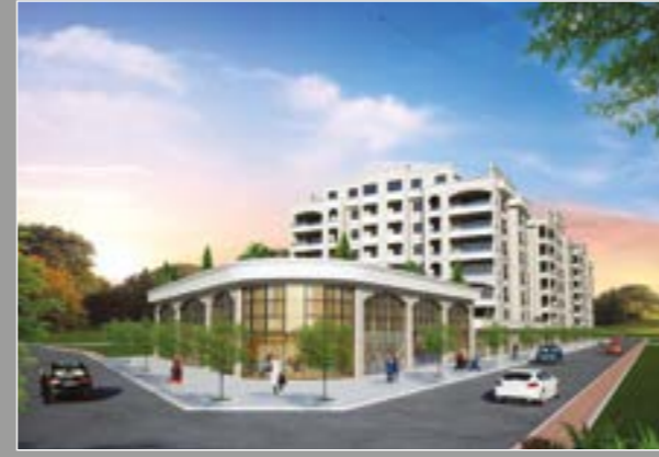
Yıldırım Sanabel Evleri 3