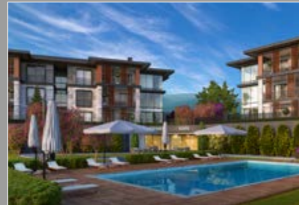
Gümüştepe Sanabel Konakları 1