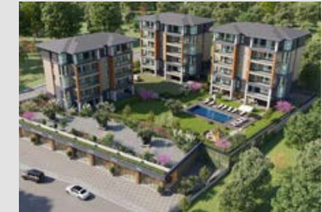
Kayapa Sanabel Konakları 1