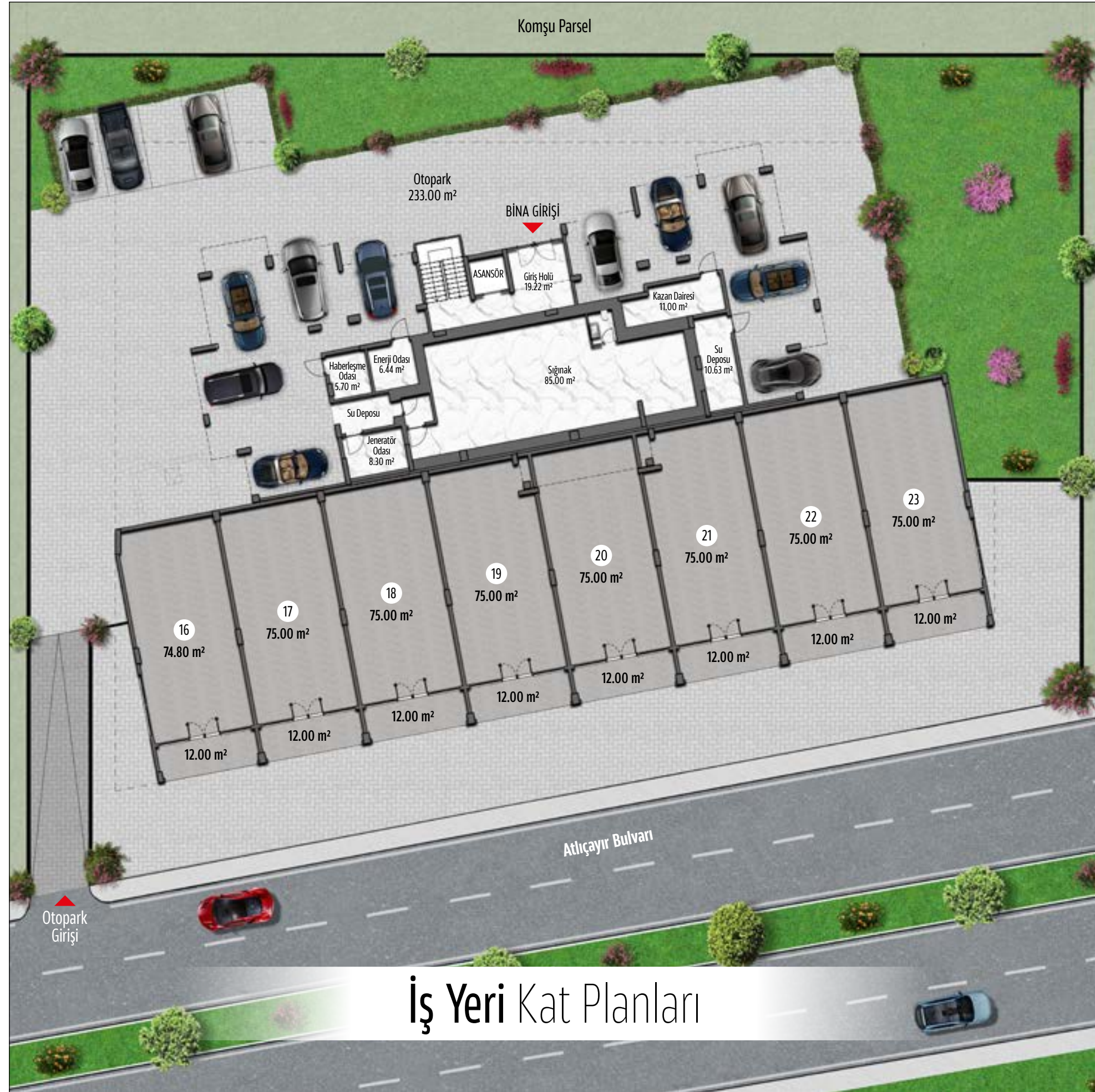
İş Yeri Kat Planları