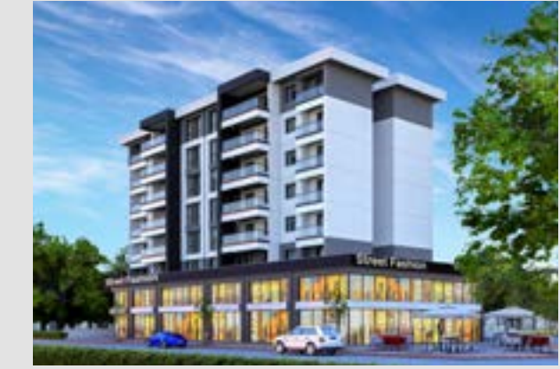
Yıldırım Sanabel Evleri 5