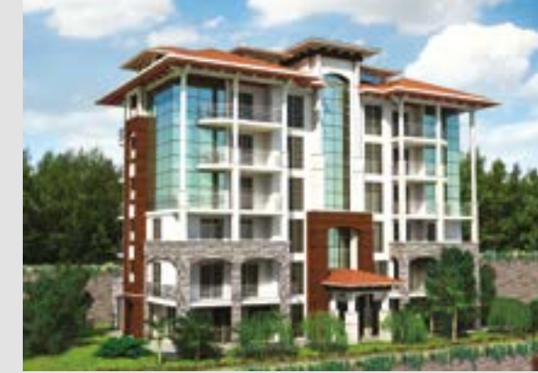
Beşevler Sanabel Konakları