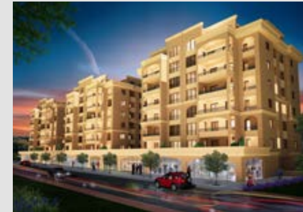
Yıldırım Sanabel Evleri 2