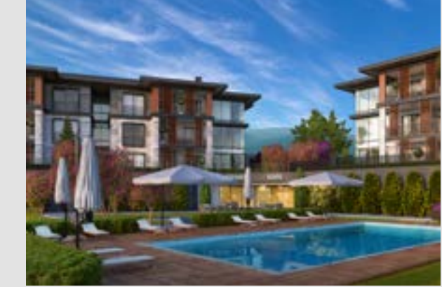
Gümüştepe Sanabel Konakları 1