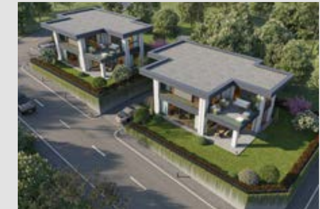
Gümüştepe Sanabel Villaları 2