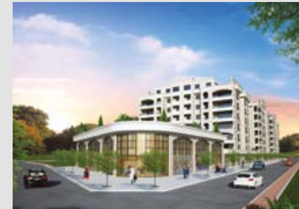
Yıldırım Sanabel Evleri 3